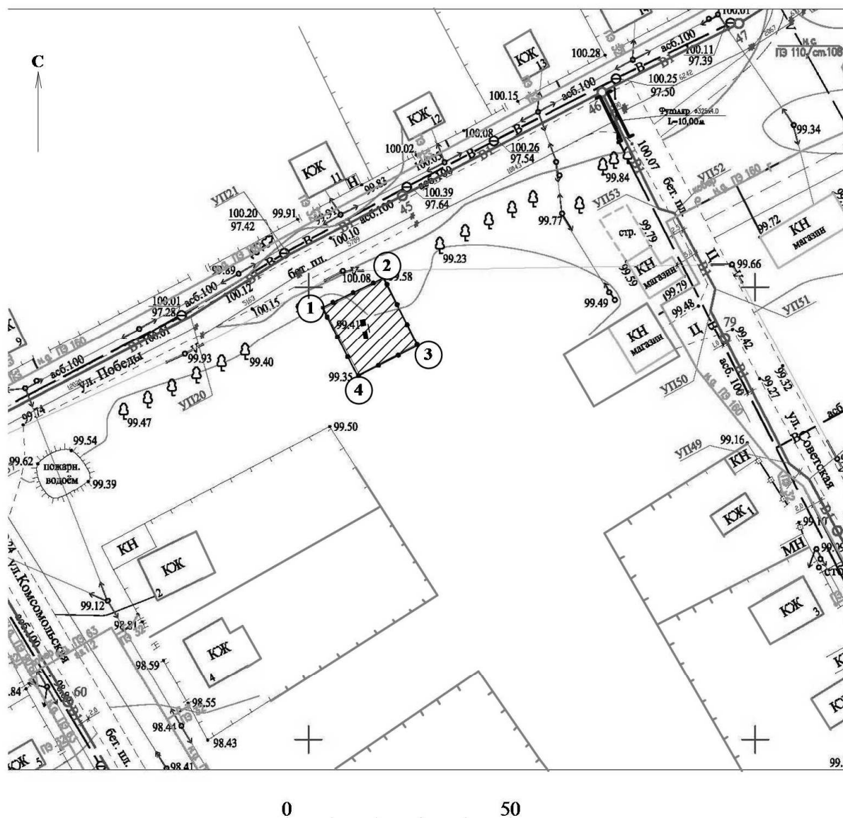
Схема границ территории объекта культурного наследия регионального значения «Братская могила советских воинов, погибших в период Сталинградской битвы», 1942-1943 гг., по адресу: Волгоградская область, Светлоярский район, с. Ивановка, в сквере у магазина